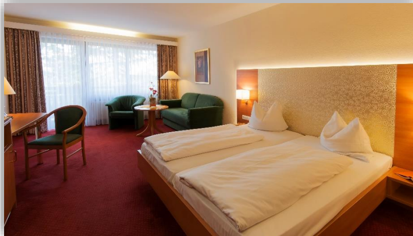
Zimmer im Hotel Residenz Immenhof